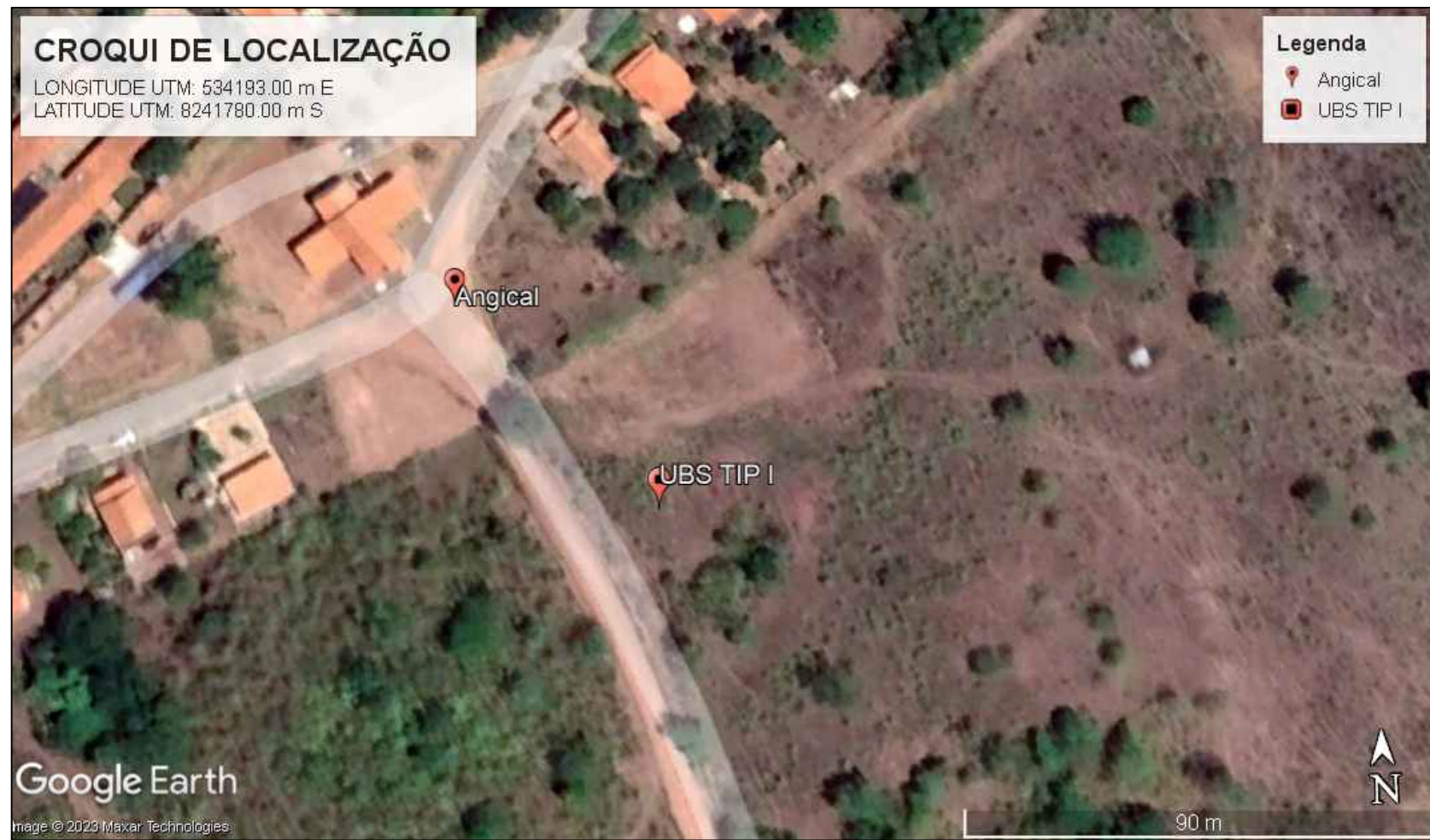
CROQUI DE LOCALIZAÇÃO ESCALA SEM ESCALA UBS PADRÃO ALVENARIA – TIPO I